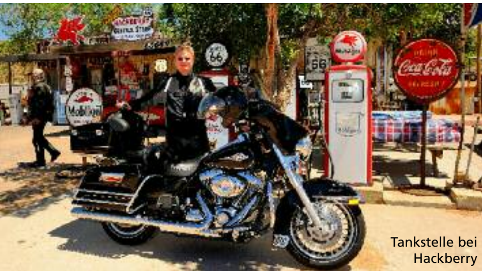
Tankstelle bei Hackberry