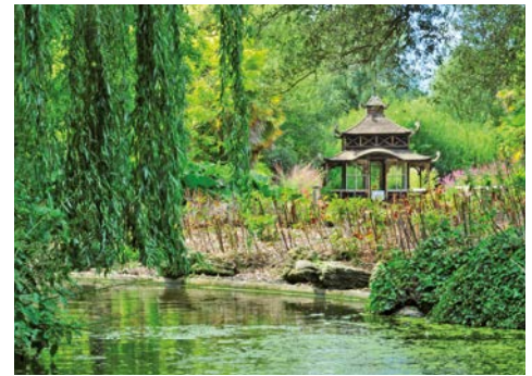
Japanischer Garten im Samares Manor

In der Tat wirkt die zweitgrößte der Kanalinseln etwas verschlafener als ihre große Schwester Jersey – abwechslungsreiche Hügellandschaften mit einer vom Klima verwöhnten Vegetation, weiße Sandstrände mit wogendem Dünengras und imposante Steilklippen mit herrlichen Aussichten bezaubern jeden Besucher. Nach der Fährüberfahrt erwartet Sie ein grandioser Anblick: der berühmteste Hafen der Kanalinseln empfängt Sie in Guernseys fantastischer Inselhauptstadt St. Peter Port. Bei einem geführten Stadtrundgang durch die verwinkelten Kopfsteinpflastergasen genießen Sie das unverwechselbare Flair des charmanten Städtchens. Am Nachmittag unternehmen Sie eine Inselrundfahrt Richtung Norden – die ungezählten Buchten sind noch genauso malerisch wie 1883, als Auguste Renoir sie in Öl malte. Das Inselinnere besticht durch verträumte Täler, meterhohe grüne Hecken, efeuberankte Steinmauern und wunderschöne Gärten. Dort erwartet Sie „Little Chapel“, die kleinste Kirche der Welt.