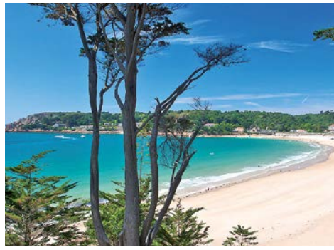
Endloser Sandstrand in der St. Brelade's Bay

Entlang der zauberhaften Südküste fahren Sie zum charmanten Hafenstädtchen St. Aubin, dessen malerischer Hafen mit seinen Palmen und Cafés ein unverwechselbares mediterranes Flair vermittelt. Am endlosen Sandstrand der Brelade's Bay besichtigen Sie die stimmungsvolle „Fisherman's Chapel“ bevor Sie zur Südwestspitze weiterfahren. Dort erleben Sie einen der eindrucksvollsten Punkte Jerseys: den weißgetünchten Corbière-Leuchtturm, der bei Flut auf einem meeresumspülten Felsen majestätisch über dem Wasser schwebt. Anschließend besuchen Sie die Weingärten und Obstplantagen des traditionellen Weingutes „La Mare Wine Estate“. Bei der Besichtigung lernen Sie u. a. die traditionelle Art der Destillation von Apple Brandy kennen und natürlich darf dabei eine kleine Wein- und Brandyprobe nicht fehlen. Auf den „Green Lanes“, den schmalen Inselstraßen, geht die Fahrt weiter durch das sanft gewell-