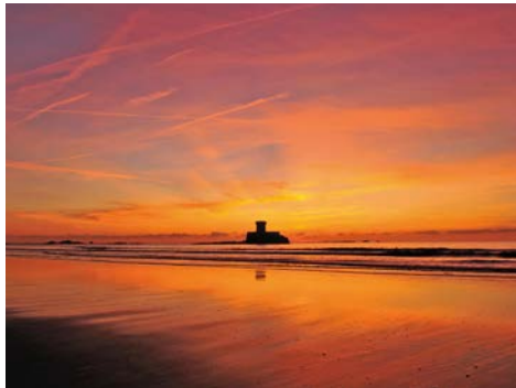
Sonnenuntergang über dem Atlantik