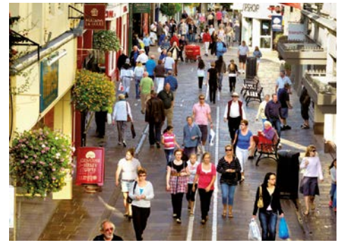
Shopping im charmanten St. Peter Port

Sie genießen die Fahrt durch Jane-Austen-Landschaften mit kapitalen Eichen und Kastanienbäumen, hellblauen Hortensien und Mauern aus Granit, hinter denen sich eindrucksvolle Herren- oder Farmhäuser verstecken. Sie spazieren durch den preisge-