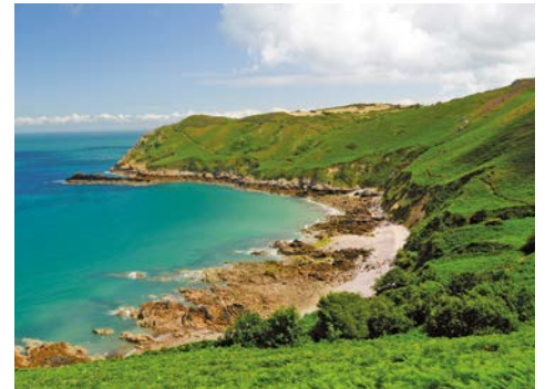
Grün bewachsene Felsküsten

16.04. - 23.04.18 • Flug ab/an Düsseldorf • ab € 1.099,- p.P. im Doppelzimmer