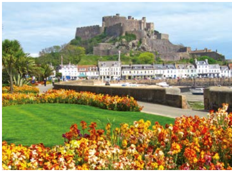
Jersey's Wahrzeichen: Mont Orgueil

Helier aus gezeitenabhängig bequem zu Fuß oder mit einem Amphibienfahrzeug erreichen können. Museumsliebhabern empfehlen wir den Besuch der „Jersey War Tunnels“. Die berühmte und preisgekrönte Ausstellung erzählt in einem weitverzweigten unterirdischen Tunnelsystem die spannende Geschichte der Inselbewohner unter der deutschen Besatzung während des 2. Weltkrieges und erinnert eindrucksvoll mit O-Tönen und Original-Mobiliar an diese Zeit zurück. Für die Naturliebhaber unter Ihnen bieten wir unsere beliebte Klippenwanderung an - da waren sich bisher alle Gäste einig: dies war ein besonderes Highlight der Jersey-Reise!