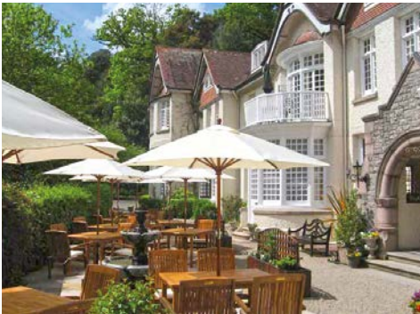
Cream Tea im „Chateau la Chaire“