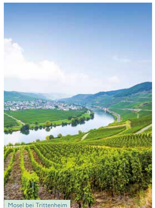
Mosel bei Trittenheim

Links und rechts von sattgrünen Weinterrassen und traditionellen Weingütern umgeben, sichten Sie das malerische Bernkastel mit seinem mittelalterlichen Marktplatz und das geschichtsträchtige Trier mit seinen römischen Kaiserthermen. Was meinen Sie, wo es Ihnen wohl besser gefallen wird?