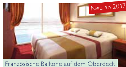
Französische Balkone auf dem Oberdeck