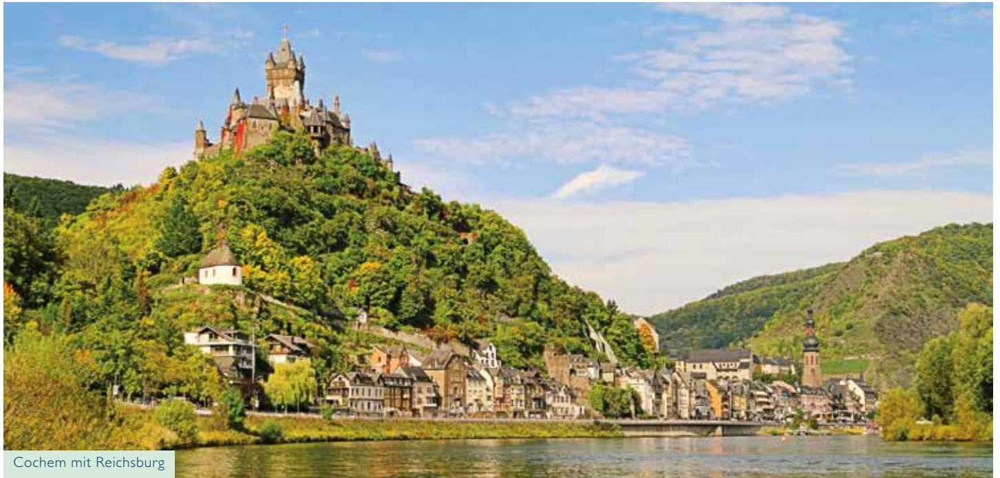
Cochem mit Reichsburg