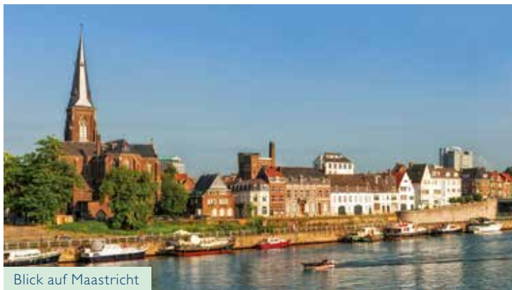
Blick auf Maastricht