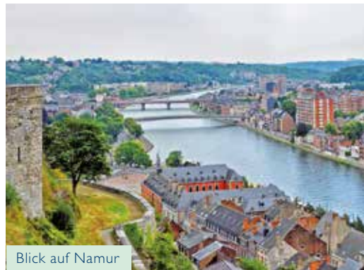
Blick auf Namur