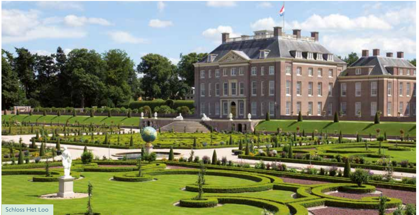
Schloss Het Loo