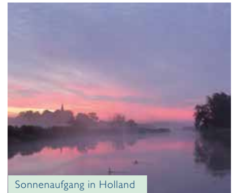
Sonnenaufgang in Holland