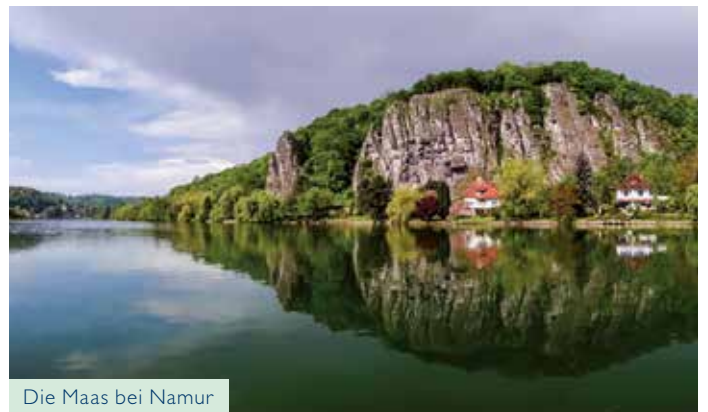
Die Maas bei Namur

Stattliche Dünen, weite Heideflächen, dichte Wälder – ja, Sie sind wirklich in den Niederlanden angekommen! Der Nationalpark De Hoge Veluwe überwältigt Sie nicht nur mit einer abwechslungsreichen Szenerie, sondern überrascht Sie auch noch mit einem imposanten Jagdschloss in Form eines Hirschgeweihs und einem raffinierten Museum – bestückt mit der zweitgrößten Van-Gogh-Sammlung der Welt!