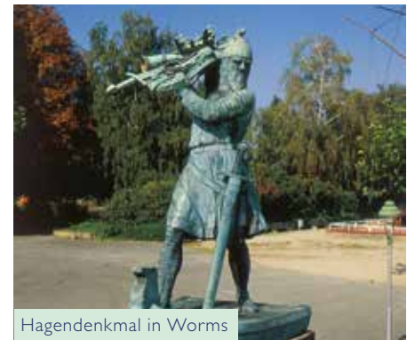
Hagendenkmal in Worms