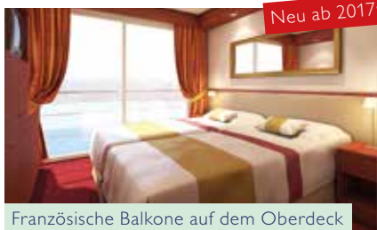
Französische Balkone auf dem Oberdeck

An Bord der ELEGANT LADY wird Komfort groß geschrieben: Die hellen Kabinen sind angenehm geräumig. Zum Oberdeck nehmen Sie einfach den gläsernen Fahrstuhl und zum Sonnendeck den Treppenlift. Die großzügige Skylounge mit Bar, die im Frühjahr und Herbst beheizt wird, garantiert Ihnen einen freien Blick auf Städte und Landschaften. Auf dem Sonnendeck stehen ausreichend Sitzmöglichkeiten und Liegestühle für Sie bereit. Eine kleine Bibliothek mit Kamin sowie ein WLAN-Zugang und ein kleiner Shop runden das Angebot ab – für viele erholsame Stunden an Bord.