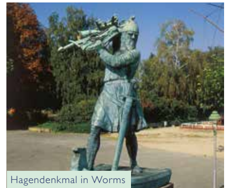
Hagendenkmal in Worms