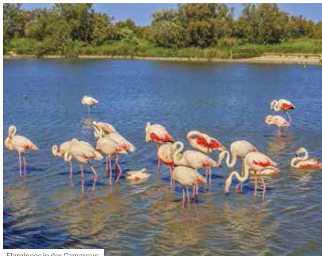
Flamingos in der Camargue