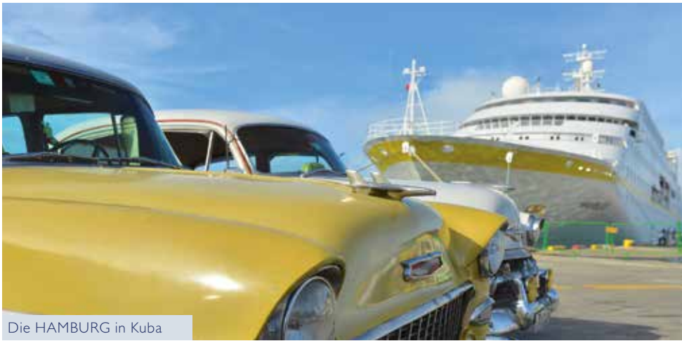
Die HAMBURG in Kuba