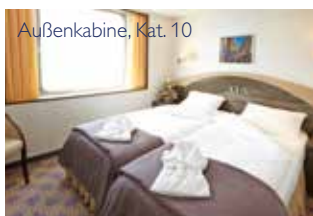
Außenkabine, Kat. 10