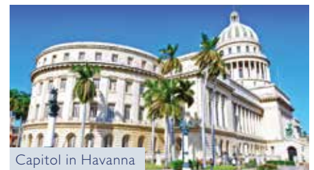
Capitol in Havanna