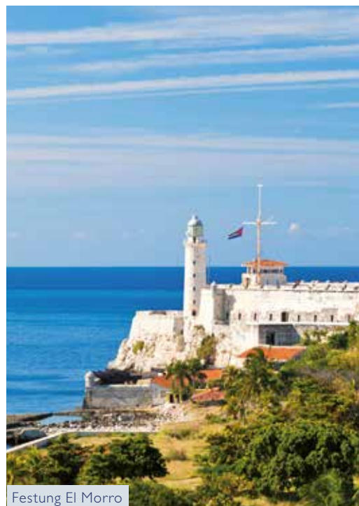
Festung El Morro

Den Abstecher nach Jamaika sichtlich genossen, legen Sie im Hafen von Santiago de Cuba an. Mutigen Schrittes den Aussichtspunkt Gran Piedra erklommen, blicken Sie über die atemberaubenden Gebirgszüge oder von der Festung El Morro über die weite Bucht. Am weißen Strand von Antilla und an Deck der HAMBURG noch einmal ausreichend Sonne getankt, sagen Sie Kuba schließlich Lebewohl.