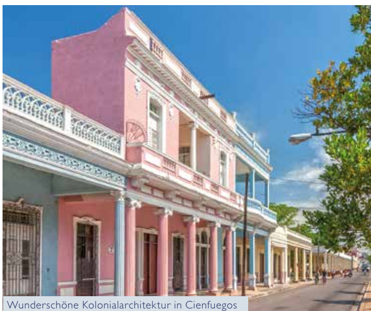
Wunderschöne Kolonialarchitektur in Cienfuegos