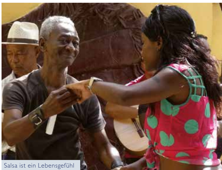
Salsa ist ein Lebensgefühl

Reise-Nr. HAM 28/2017 · 11 Tage vom 29.11. bis 09.12.2017