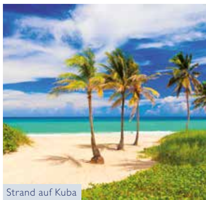
Strand auf Kuba