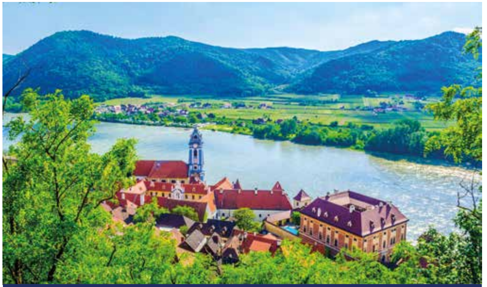
Der markante blau-weiße Turm der Stiftskirche in Dürnstein gilt als Wahrzeichen der Wachau