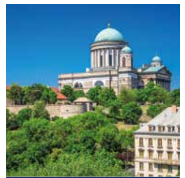
Das Panorama von der Basilika in Esztergom ist fantastisch