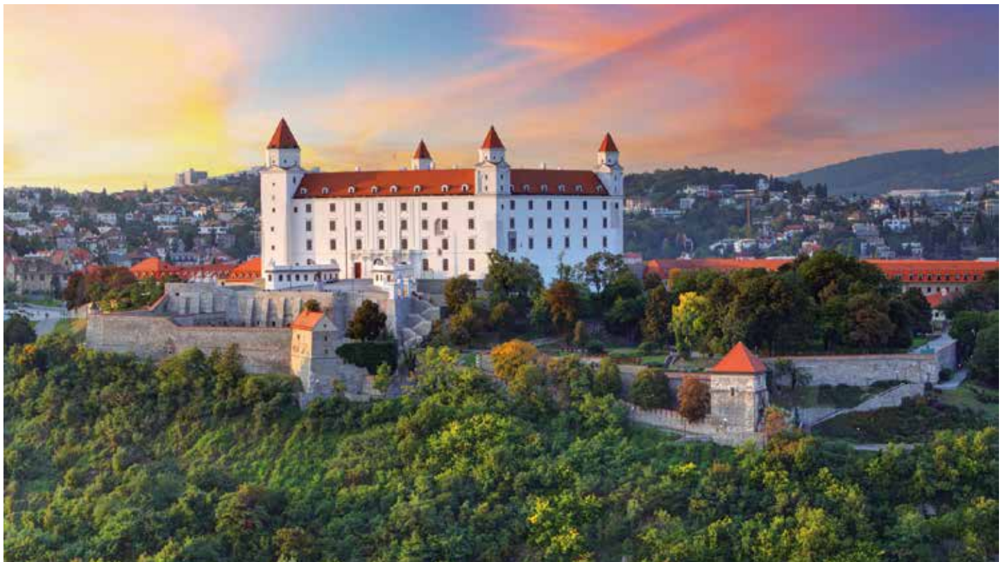
Die imposante Burg Bratislava ist heute Sitz des Historischen Museums