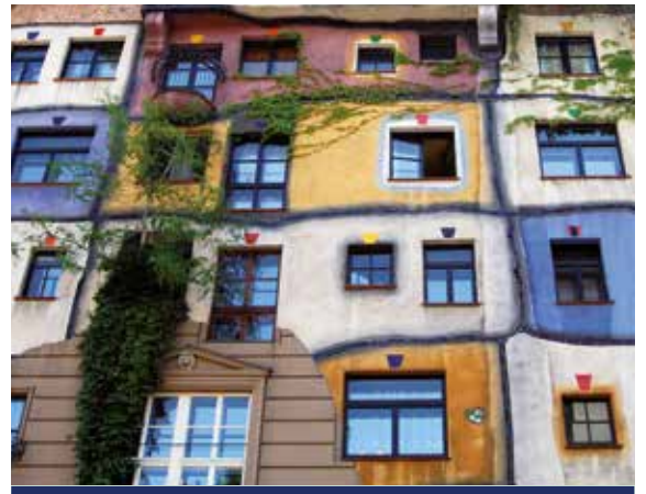
Das Hundertwasserhaus in Wien