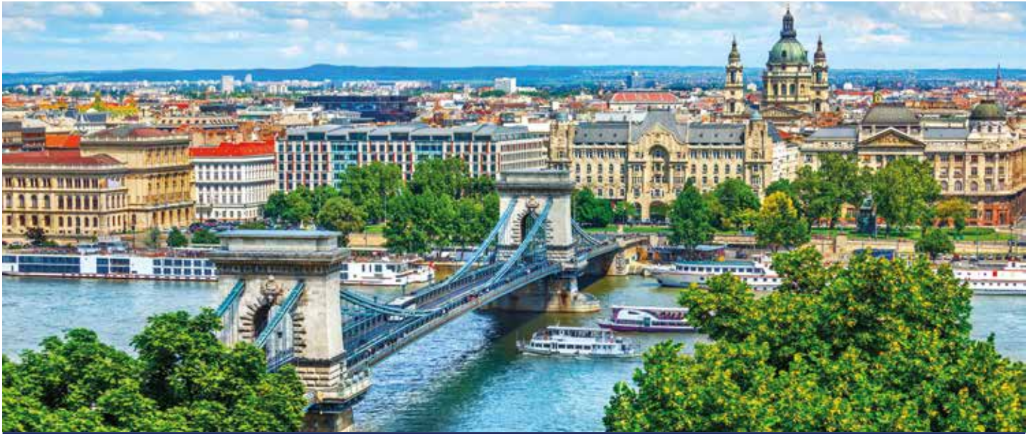
Die Kettenbrücke ist eines der berühmtesten Wahrzeichen der Stadt Budapest

Alle wichtigen Donaumetropolen innerhalb von 6 Tagen! Lassen Sie sich einfach überraschen! Die sagenhafte Drei-Flüsse-Stadt Passau als Ausgangspunkt gewählt, empfängt Sie Wien mit dem Märchenschloss Schönbrunn, wo einst Kaiserin Sisi durch die Gänge wandelte. In Budapest schlendern Sie durch das nostalgische Burgviertel bis zum riesigen Burgpalast, bevor Sie in Bratislava die schneeweiße Pressburg erklimmen, die Ihnen einen atemberaubenden Blick über die Donau schenkt. Einfach fantastisch! Zurück in Österreich bewundern Sie in Dürnstein noch schnell den himmelblauen Kirchturm oder im Stift Göttweig die prachtvolle Barockkirche. Eins ist sicher: Diese raffinierte Donaureise macht Lust auf mehr!