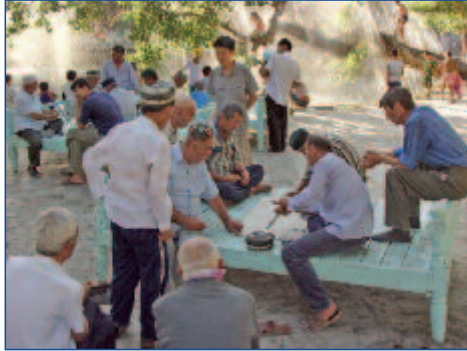
Orientalische Lebensart ...