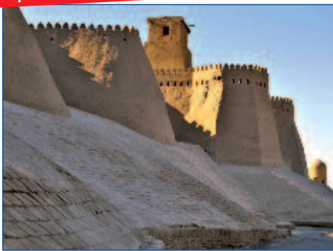
Die Stadtmauer von Chiwa