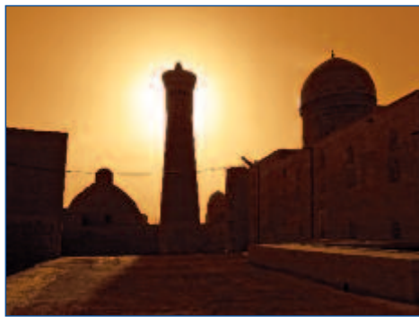
Sonnenuntergang über Bukhara