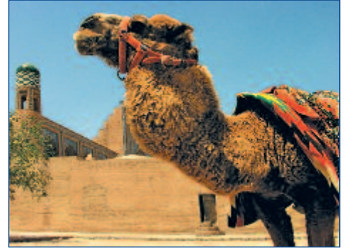
Transportmittel in der Wüste: Reitkamel

kand (voraussichtliche Zugfahrzeiten: Hinfahrt 06:20 - 10:00 Uhr, Rückfahrt: 18:20 - 22:00 Uhr).