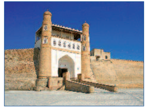
Die Ark-Festung in Bukhara

Heute besichtigen Sie den bekanntesten Platz Usbekistans, den Registan. Er ist umgeben von den drei großen Medresen Ulugbek, Ti-lya Kuri und Sher Dur, in denen bis ins 19. Jahrhundert unterrichtet wurde. Ein Bau ist prächtiger als der andere, farbenfrohe Kacheln lassen den Platz erstrahlen. Antike Mausoleen erforschen Sie in der Totenstadt Shah-i Sinda. In der Nekropole im Norden Samarkands ziehen sich Dutzende Grabmale des Herrschers Timur-Leng und seiner Nachfahren den Hügel hinauf. In einer weiteren Grabstätte – dem Gur Amir Mausoleum – wurden ebenfalls bedeutende Timuriden bestattet. Für die damalige, wissenschaftliche Bedeutung Samarkands spricht das Observato-