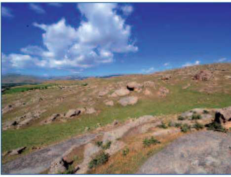
Ihre Reise führt Sie entlang grandioser Landschaften