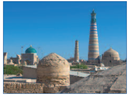
Das Minarett Islam Khodja in Chiwa