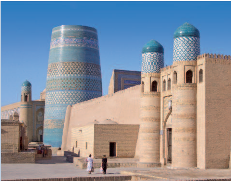
Kalta Minor in Chiwa

S eit 2000 Jahren verbindet die sagenumwobene Seidenstraße China mit dem Abendland. Allein ihr Name weckt Träume von Karawanen, kostbaren Stoffen und orientalischen Gewürzen. Im einstigen Reich Dschingis Khans sind die Zeugen der Vergangenheit noch lebendig: Prachtvolle Bauwerke mit kunstvollen Ornamenten und Mosaiken prägen das Bild des antiken Samarkand, typisch islamische Architektur ist in Bukhara zu finden. Abseits der Städte fasziniert eine außergewöhnliche Landschaft. Verlassene Karawanseerien liegen in der großen Wüste Kizilkum, die von einem der längsten Flüsse Zentralasiens – dem Amudarja - begrenzt wird. Überall trifft man auf eine schier unglaubliche Gastfreundschaft! Noch ist die Seidenstraße ein Geheimtipp für Reisende. Entdecken Sie hier den unverfälschten Orient mit all seiner Magie und Mystik!