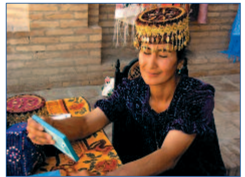
Traditionen werden bewahrt

05.04. BIS 12.04.2012 • FLUG AB/AN DORTMUND • AB € 1.395,- P.P. IM DZ