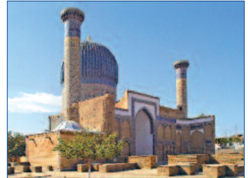
Gur Amir Mausoleum

rium des Astronomen Ulugh Beg. Bestaunen Sie den jahrhundertealten, erstaunlich genauen Sextanten auf dem Hügel der Chupanat-Kette.