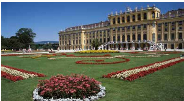
Das Schloss Schönbrunn in Wien zählt zu den schönsten Barockanlagen Europas

Alle wichtigen Donaumetropolen innerhalb von 6 Tagen! Lassen Sie sich einfach überraschen! Die sagenhafte Drei-Flüsse-Stadt Passau als Ausgangspunkt gewählt, empfängt Sie Wien mit dem Märchenschloss Schönbrunn, wo einst Kaiserin Sisi durch die Gänge wandelte. In Budapest schlendern Sie durch das nostalgische Burgviertel bis zum riesigen Burgpalast, bevor Sie in Bratislava die schneeweiße Pressburg erklimmen, die Ihnen einen atemberaubenden Blick über die Donau schenkt. Einfach fantastisch! Zurück in Österreich bewundern Sie in Dürnstein noch schnell den himmelblauen Kirchturm oder im Stift Göttweig die prachtvolle Barockkirche. Eins ist sicher: Diese raffinierte Donaureise macht Lust auf mehr!