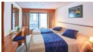
2-Bettkabine Deluxe mit franz. Balkon