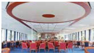
Die Panorama-Lounge mit Bar und Tanzfläche

Ausstattung: Dusche/WC, Föhn, regulierbare Klimaanlage, Haartrockner, TV, Radio, Telefon, Safe