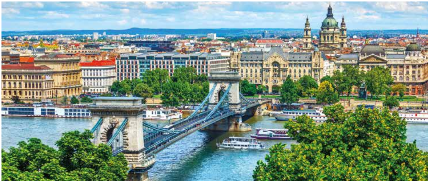
Die Kettenbrücke ist eines der berühmtesten Wahrzeichen der Stadt Budapest

Alle wichtigen Donaumetropolen innerhalb von 6 Tagen! Lassen Sie sich einfach überraschen! Die sagenhafte Drei-Flüsse-Stadt Passau als Ausgangspunkt gewählt, empfängt Sie Wien mit dem Märchenschloss Schönbrunn, wo einst Kaiserin Sisi durch die Gänge wandelte. In Budapest schlendern Sie durch das nostalgische Burgviertel bis zum riesigen Burgpalast, bevor Sie in Bratislava die schneeweiße Pressburg erklimmen, die Ihnen einen atemberaubenden Blick über die Donau schenkt. Einfach fantastisch! Zurück in Österreich bewundern Sie in Dürnstein noch schnell den himmelblauen Kirchturm oder im Stift Göttweig die prachtvolle Barockkirche. Eins ist sicher: Diese raffinierte Donaureise macht Lust auf mehr!