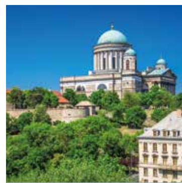
Das Panorama von der Basilika in Esztergom ist fantastisch