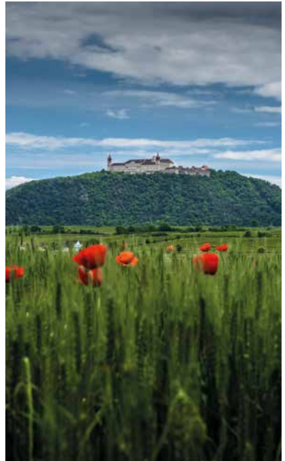
Wie eine sakrale Burg wacht das Stift Göttweig südlich von Krems über den Osteingang der Wachau