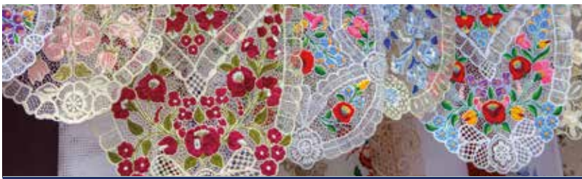
Feine Handarbeit – schöne ungarische Stickereien sehen Sie in Budapest

Alle Zeiten sind Richtzeiten. Programmänderungen, auch durch Hoch- und Niedrigwasser, oder Verzögerungen bei Schleusendurchfahrten sind vorbehalten. Das Landausflugsprogramm erhalten Sie ca. 6 Wochen vor Reisebeginn. Die Landausflüge sind nicht im Reisepreis enthalten. HT = Halbtagesausflug