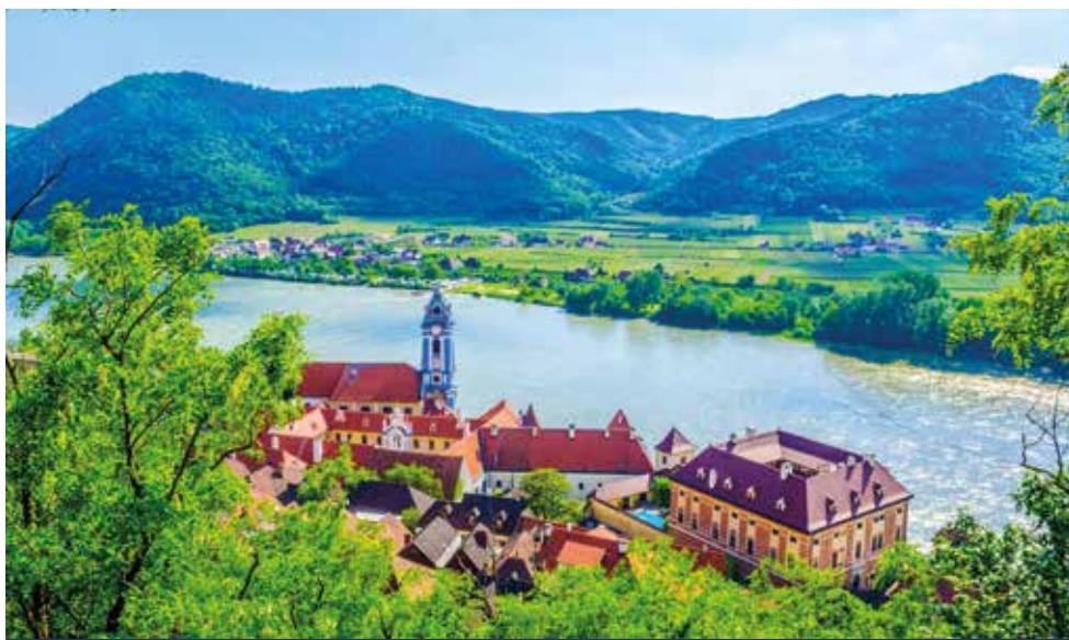
Der markante blau-weiße Turm der Stiftskirche in Dürnstein gilt als Wahrzeichen der Wachau