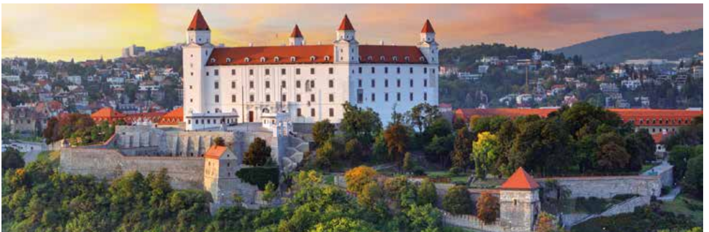
Die imposante Burg Bratislava ist heute Sitz des Historischen Museums