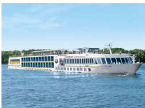
MS ROUSSE PRESTIGE – Die elegante Art zu Reisen