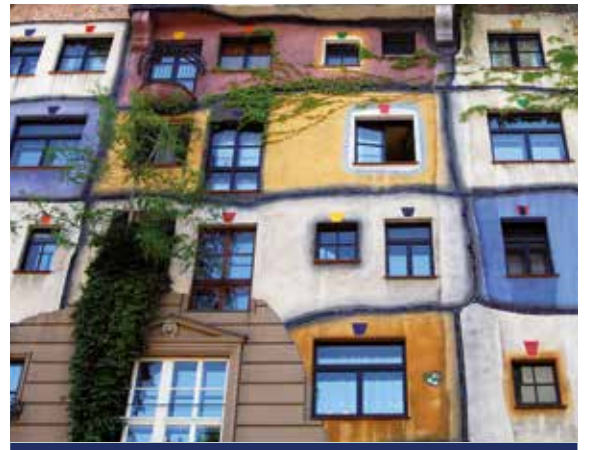
Das Hundertwasserhaus in Wien