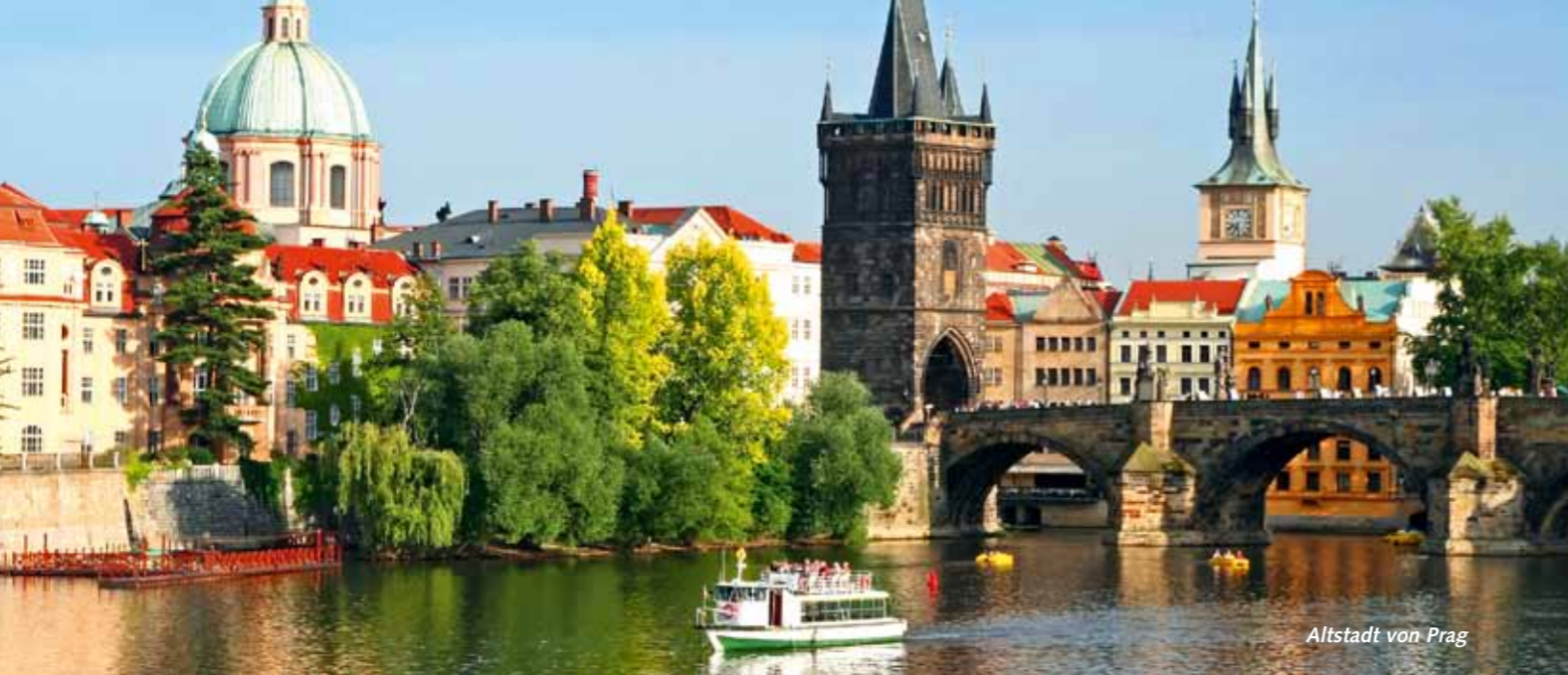
Altstadt von Prag