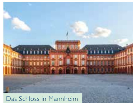
Das Schloss in Mannheim