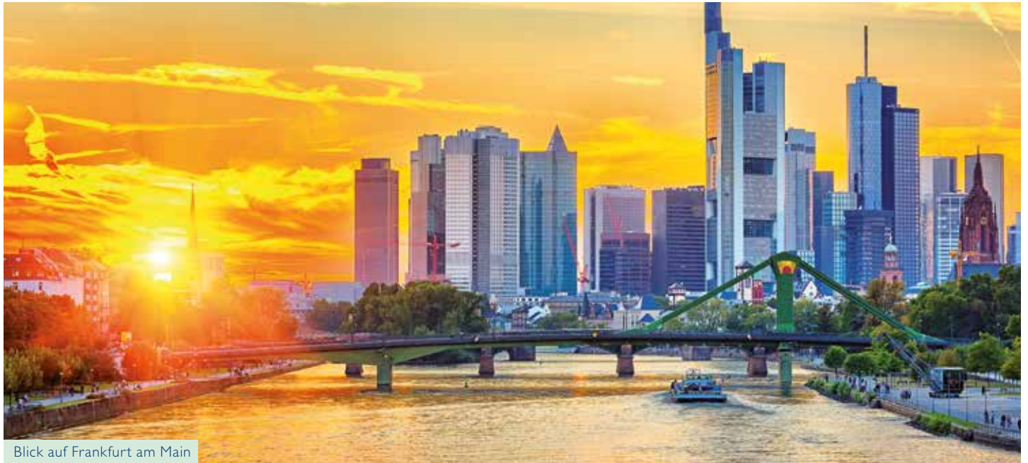
Blick auf Frankfurt am Main