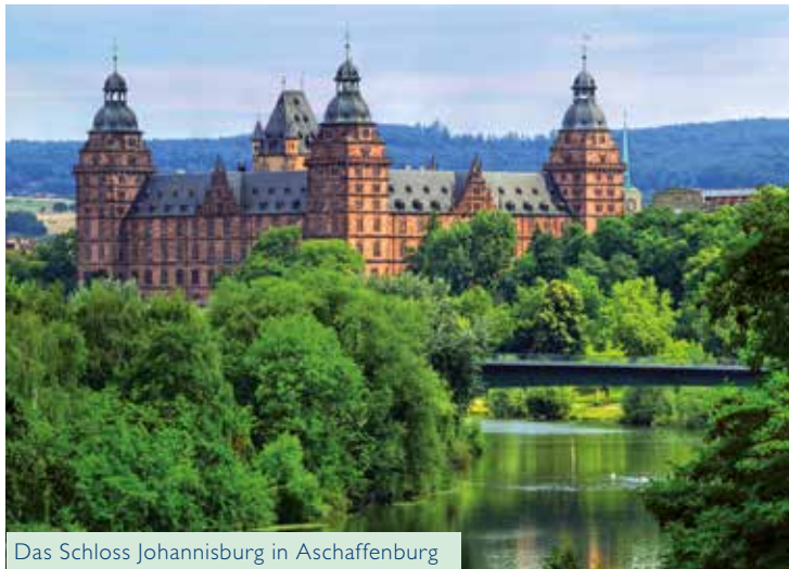
Das Schloss Johannisburg in Aschaffenburg