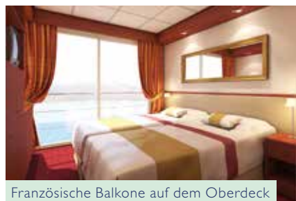
Französische Balkone auf dem Oberdeck