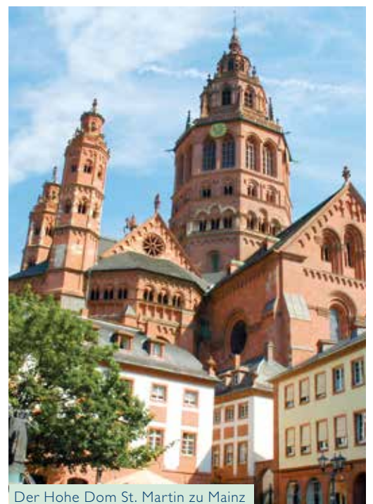
Der Hohe Dom St. Martin zu Mainz

In Aschaffenburg gebührend den Mai begrüßt, bestaunen Sie in Miltenberg die nostalgischen Fachwerkhäuser und in Wertheim die mittelalterliche Burgruine. Da taucht auch schon die Festung Marienberg am Mainufer auf: Ob Bummel durch den üppigen Ringpark bis zur Altstadt oder Besuch der Landesgartenschau 2018 – im Wonnemonat Mai ist Würzburg einfach besonders sehenswert!