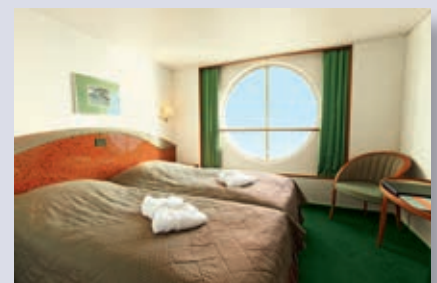
Außenkabine, Kat. 7