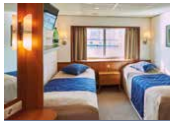
Zweibett, außen, Oberdeck große Fenster

Trinkgelder, Landausflüge, zusätzliche Veranstaltungen und private Ausgaben sind nicht im Reisepreis eingeschlossen.