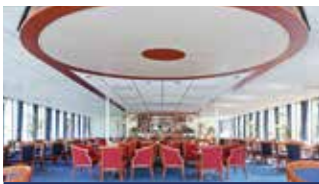
Die Panorama-Lounge mit Bar und Tanzfläche

Ausstattung: Dusche/WC, Föhn, regulierbare Klimaanlage, Haartrockner, TV, Radio, Telefon, Safe