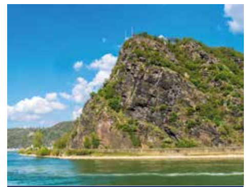
Bestaunen Sie den sagenumwobenen Loreley-Felsen