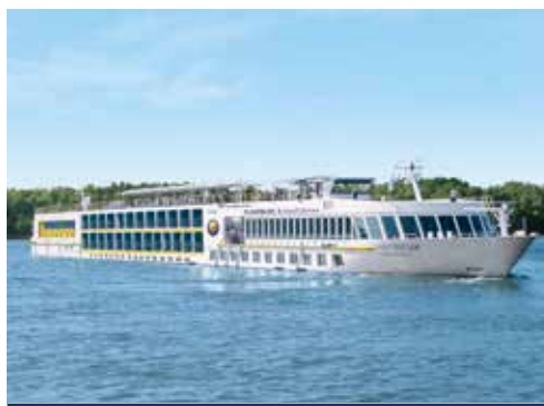
MS ROUSSE PRESTIGE – Die elegante Art zu Reisen