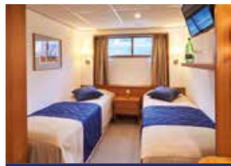
Zweibett, außen, Hauptdeck kleine Fenster