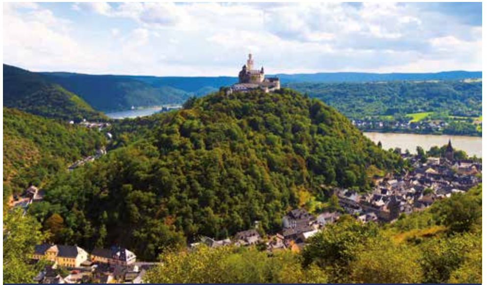
Der Romantische Rhein – eine Landschaft wie aus dem Bilderbuch