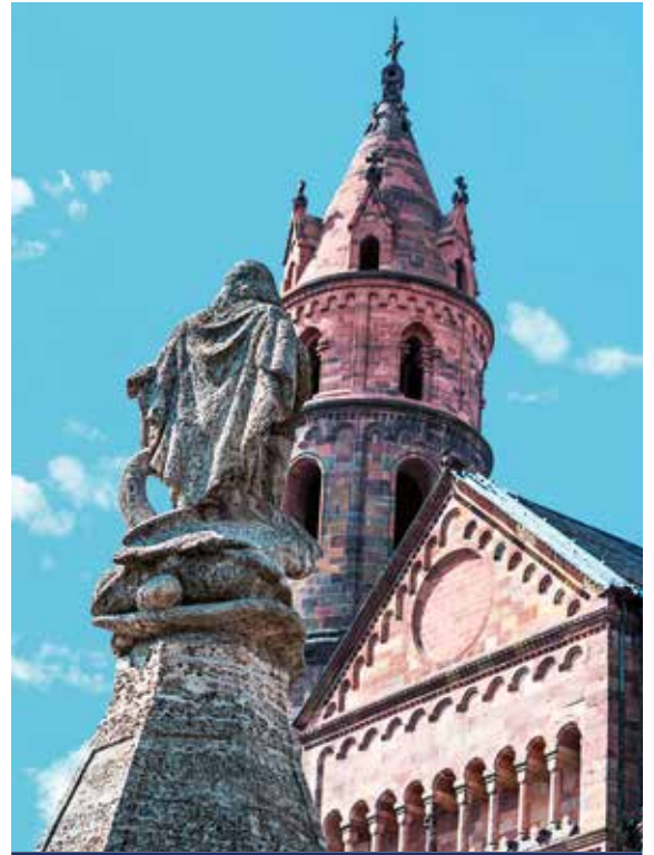
Der Dom in Worms

Alle Zeiten sind Richtzeiten. Programmänderungen, auch durch Hoch- und Niedrigwasser, oder Verzögerungen bei Schleusendurchfahrten sind vorbehalten. Das Landausflugsprogramm erhalten Sie ca. 6 Wochen vor Reisebeginn. Die Landausflüge sind nicht im Reisepreis enthalten. HT = Halbtagesausflug A = Abendausflug