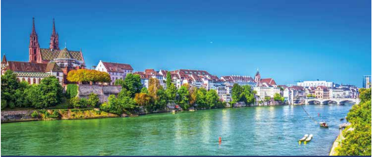
Basel, am Rhein gelegen und Grenzstadt im Dreiländereck, wo sich die Schweiz, Deutschland und Frankreich treffen

Am Rhein geben sich sagenumwobene Sehenswürdigkeiten die Hand: In Koblenz blicken Sie wie einst die Kurfürsten von der Festung Ehrenbreitstein über die Moselmündung, bevor Sie MS ROUSSE PRESTIGE weiter den Rhein hinaufträgt. Backbord ragt die legendäre Loreley 132 Meter in den Himmel hinauf – jetzt ist Rüdesheim nicht mehr weit. Gemächlich flanieren Sie durch die Altstadt, bewundern in Speyer die größte romanische Kirche der Welt oder in Straßburg die schmucken Fachwerkhäuser am Münsterplatz. Direkt am Rheinknie begeistert Sie Basel dann mit üppigen Barockpalais und Jugendstilhäusern. Ob Worms mit Hagedenkmal und Nibelungenmuseum den Städtewettbewerb noch gewinnen kann?