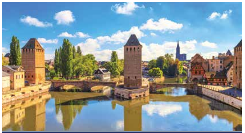
Ponts-Couverts – Überbleibsel der Stadtmauer in Straßburg