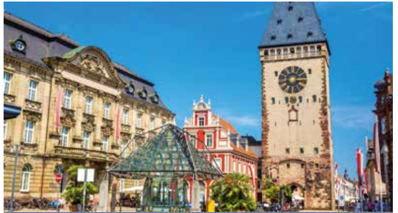
Das Altpörtel in Speyer ist mit einer Höhe von 55 Metern eines der höchsten und bedeutendsten Stadttore Deutschlands

Am Rhein geben sich sagenumwobene Sehenswürdigkeiten die Hand: In Koblenz blicken Sie wie einst die Kurfürsten von der Festung Ehrenbreitstein über die Moselmündung, bevor Sie MS ROUSSE PRESTIGE weiter den Rhein hinaufträgt. Backbord ragt die legendäre Loreley 132 Meter in den Himmel hinauf – jetzt ist Rüdesheim nicht mehr weit. Gemächlich flanieren Sie durch die Altstadt, bewundern in Speyer die größte romanische Kirche der Welt oder in Straßburg die schmucken Fachwerkhäuser am Münsterplatz. Direkt am Rheinknie begeistert Sie Basel dann mit üppigen Barockpalais und Jugendstilhäusern. Ob Worms mit Hagedenkmal und Nibelungenmuseum den Städtewettbewerb noch gewinnen kann?