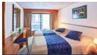
2-Bettkabine Deluxe mit franz. Balkon