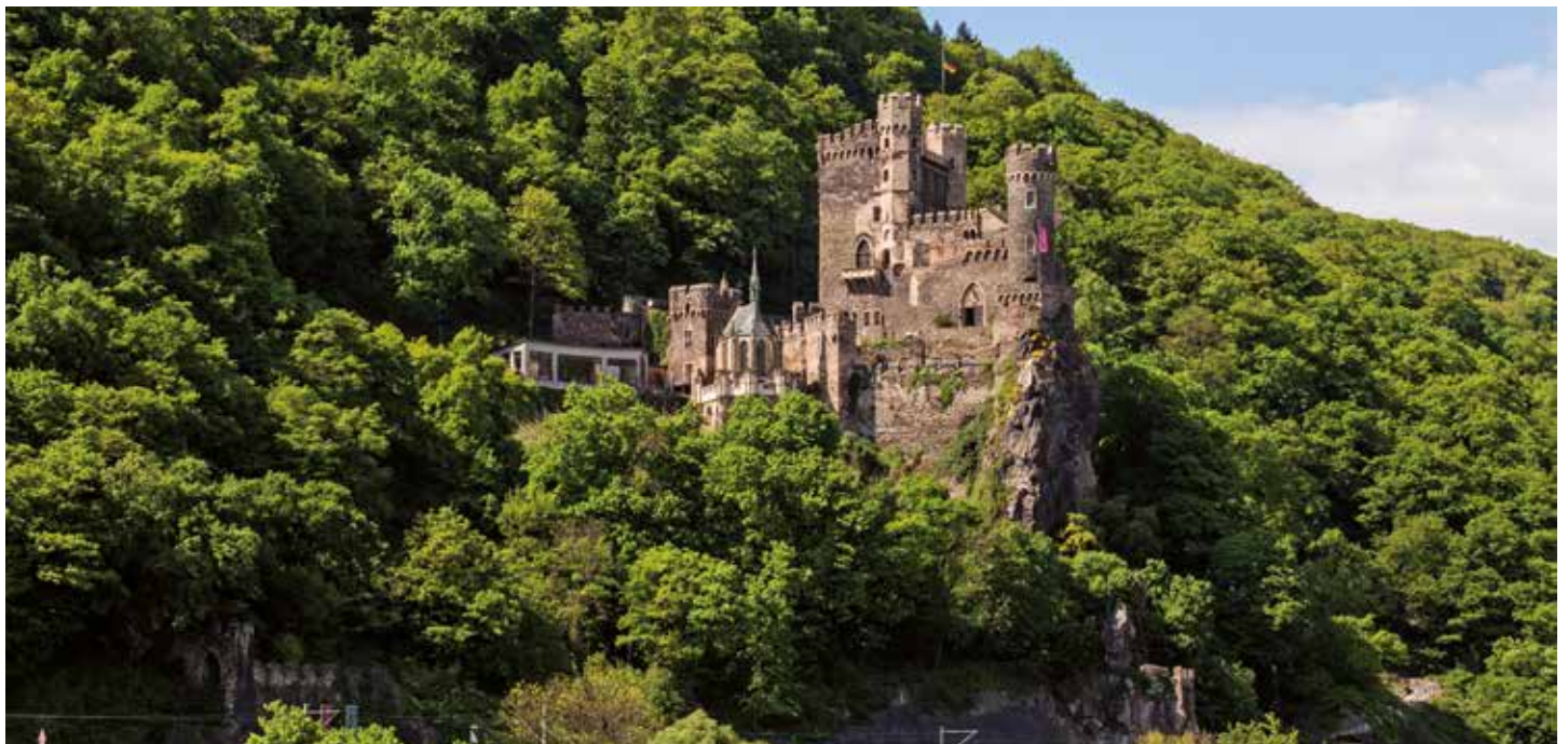
Die mittelalterliche Burg Rheinstein