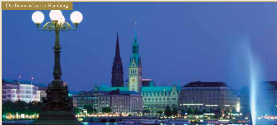
Die Binnenalster in Hamburg

Heute endet Ihre Kurzkreuzfahrt und es heißt Abschied nehmen von einem der bekanntesten Kreuzfahrtschiffe der Welt. Nach der Ausschiffung in Hamburg treten Sie die Rückreise im modernen Fernreisebus an. Auf der Heimfahrt schwelgen Sie in schönen Erinnerungen an dieses unvergessliche Erlebnis, einmal auf der Queen Mary 2 mitgereist zu sein.