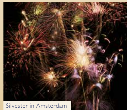
Silvester in Amsterdam

ab / bis Düsseldorf 7 Tage vom 27.12.2017 bis 02.01.2018