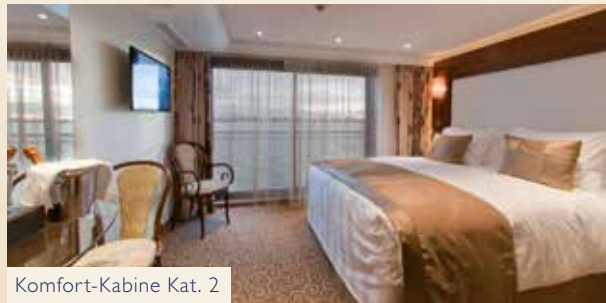
Komfort-Kabine Kat. 2