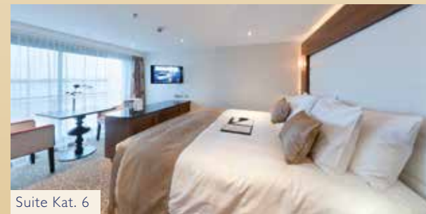
Suite Kat. 6