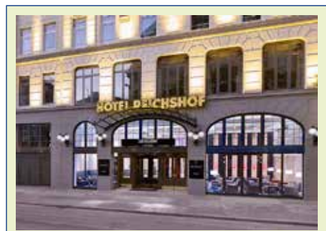
Hotel Reichshof Hamburg