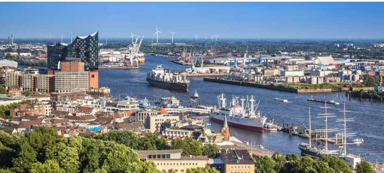
Der Hamburger Hafen - Deutschlands Tor zur Welt

Die „Elphi“, wie die im Januar 2017 eröffnete Hamburger Philharmonie im Volkshaus heißt, ist das neue Wahrzeichen der Hansestadt und weithin sichtbar. Seit ihrer Eröffnung ist sie der Publikumsmagnet und die Konzerte im Großen Saal begeistern die Zuhörer. Grund genug Hamburg und seiner neuen Perle einen Besuch abzustatten. Während Ihres dreitägigen Aufenthalts zeigen wir Ihnen darüber hinaus die zahlreichen Sehenswürdigkeiten der Metropole, bestaunen das Miniatur Wunderland und besuchen den Hamburger Hafen während einer Rundfahrt, ein Muss bei jeder Hamburg-Reise. Am zweiten Abend dann ein kulinarischer Höhepunkt, wir besuchen eine der Restaurant-Ikonen, aber lesen Sie selbst.