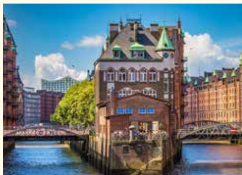
In der Speicherstadt

Genießen Sie Ihr Hilton-Frühstücksbuffet. Gegen 09:30 Uhr Fahrt zur Hamburger Elbphilharmonie. Obwohl erst wenig mehr als ein Jahr alt, ist die „Elphi“ bereits heute eines der bekanntesten Wahrzeichen der Stadt. Vor dem Konzert haben Sie genügend Zeit auf der „Elphi“-Promenade das bunte Treiben im Hafen zu genießen und Ihren Blick über die neu entstandene Hafencity zu werfen.