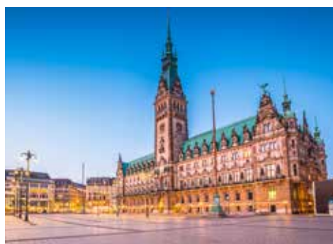
Das Hamburger Rathaus

In der Speicherstadt erwartet Sie mit dem Miniatur Wunderland eine wahre Erlebniswelt. Leuchtende Kinderaugen und staunende Erwachsene inklusive. Was hier in den letzten Jahren entstanden ist und immer noch weiter ausgebaut wird, läßt alte Kindertage wieder wahr werden. Auf mehreren Tausend Quadratmetern haben die Macher der Miniaturwelten eine Eisenbahn-Erlebniswelt der Sonderklasse entstehen lassen. Länderthemen