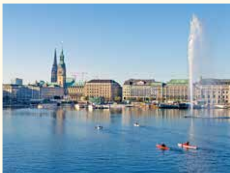
Blick über die Binnenalster