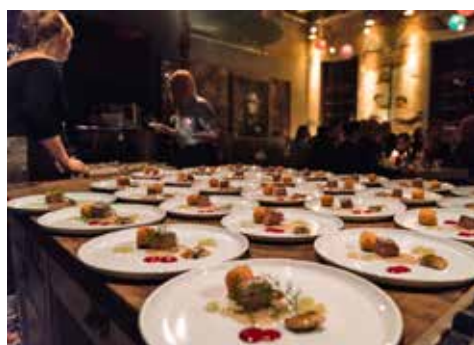
Abendessen in Tim Mälzers Bullerei

Für Frühaufsteher empfiehlt sich heute am frühen Morgen ein Besuch des berühmten Fischmarkts. Ab ca. 5 Uhr bieten dort hunderte Händler ihre Waren feil. Mit markigen Sprüchen und einer Riesenauswahl begeistern die Händler ihre Besucher