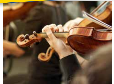
Klassisches Konzert live

28.09. - 30.09.2018 • ab € 599,- p.P. im Doppelzimmer