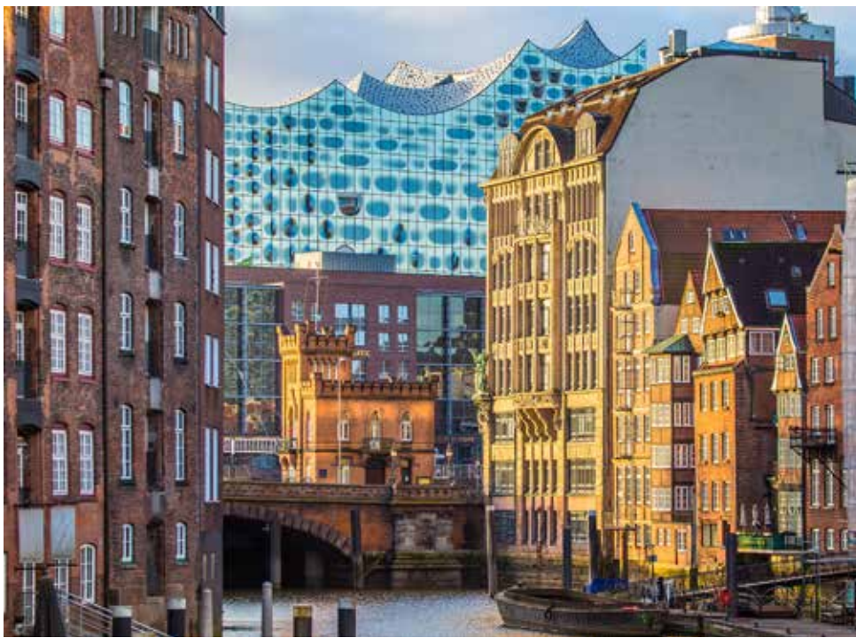
Versteckter Blick auf die Elphi

Um 11 Uhr beginnt dann im großen Saal Ihre Matinee mit den Hamburger Synchronikern. Ein einmaliges Klangerlebnis und ein abwechslungsreiches Programm inklusive. Nach dem Konzertbesuch unternehmen Sie dann eine Barkassen-Rundfahrt durch den Hamburger Hafen. Ihr Kapitän wird Sie mit der Historie und den Geschichten rund um den Hafen vertraut machen.