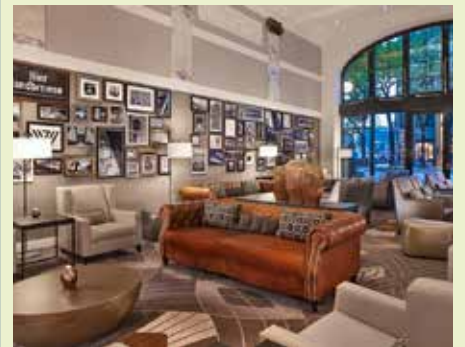
Lobby des Hotels Reichshof