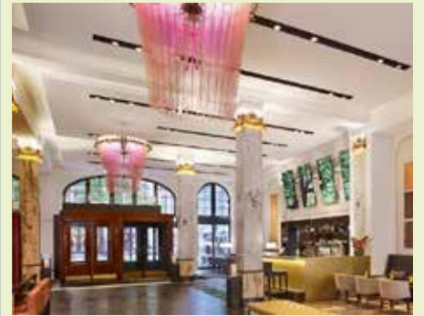
Im Stil der 20er Jahre