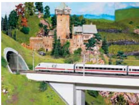
Impressionen im Miniatur Wunderland