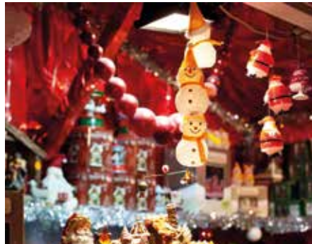
Erleben Sie stimmungsvolle Weihnachtsmärkte