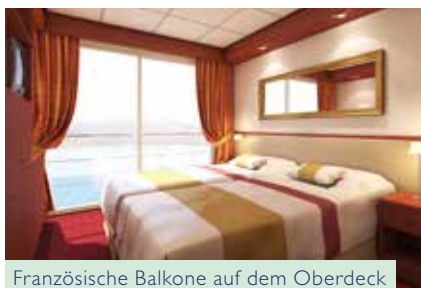
Französische Balkone auf dem Oberdeck