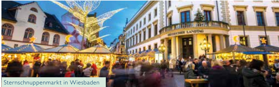
Sternschnuppenmarkt in Wiesbaden