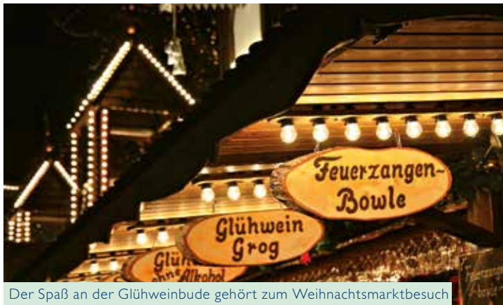
Der Spaß an der Glühweinbude gehört zum Weihnachtsmarktbesuch