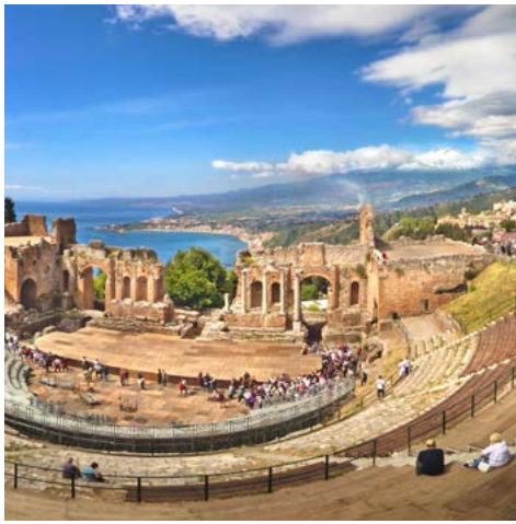
Das Freilichttheater in Taormina