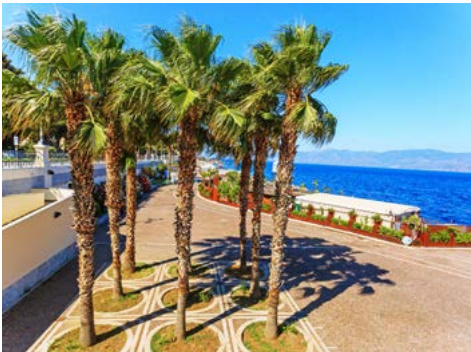
Promenade von Reggio Calabria