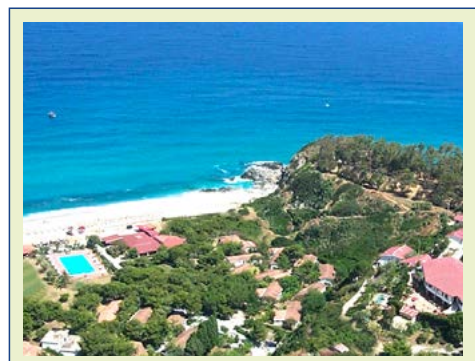
Direkt am Meer: BV Kalafiorita Resort