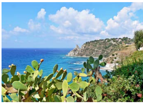
Am Capo Vaticano