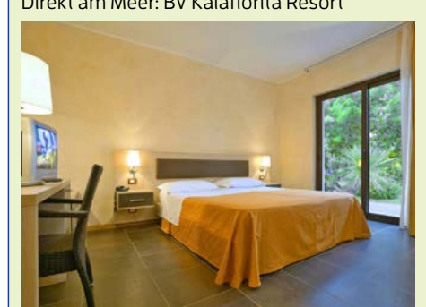
Villaggio Borgo del Principe: Zimmerbeispiel

essen wird im Hotel serviert. Oder Sie buchen vorab den