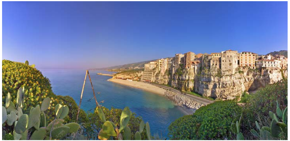
Blick auf Tropea