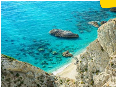
Die kalabrische Küste