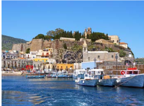
Im Hafen von Lipari