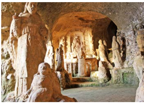
Chiesa di Piedigrotta