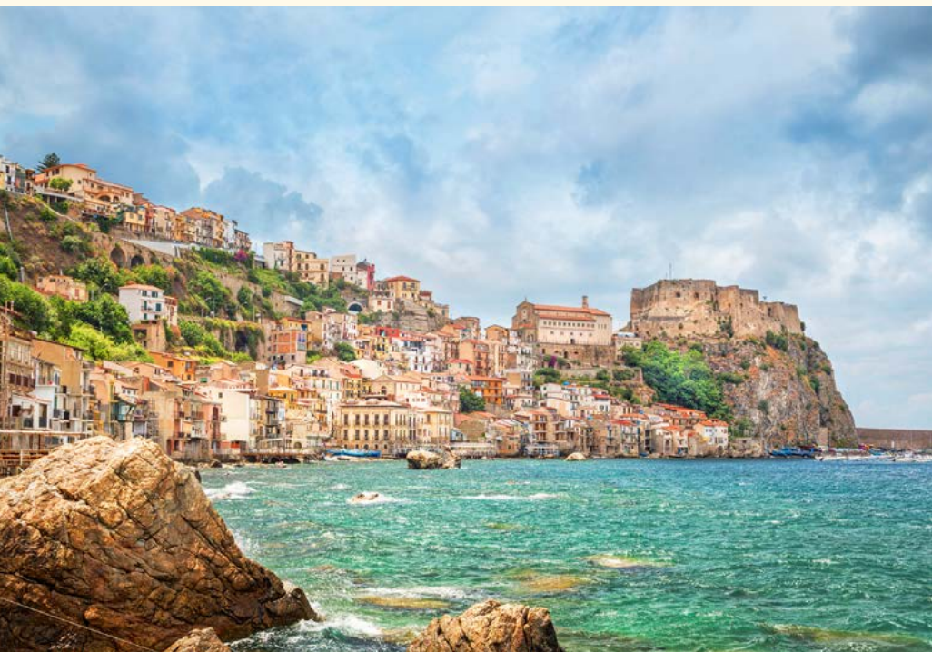
Scilla mit Castello Ruffo