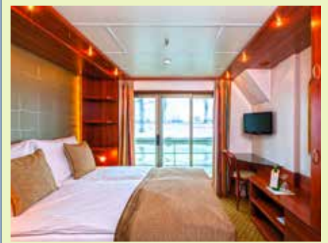
Französische Balkone auf dem Rubindeck