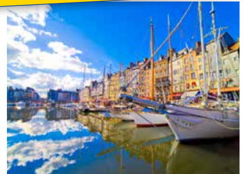
Der alte Hafen von Honfleur

11.08. - 18.08.2018 • ab/an Paris • ab € 1.199,- p.P. in der 2-Bett-Außenkabine