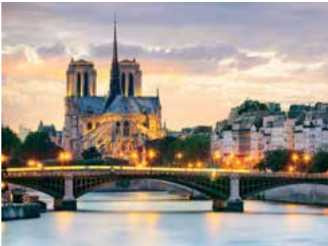
Lichterfahrt in Paris