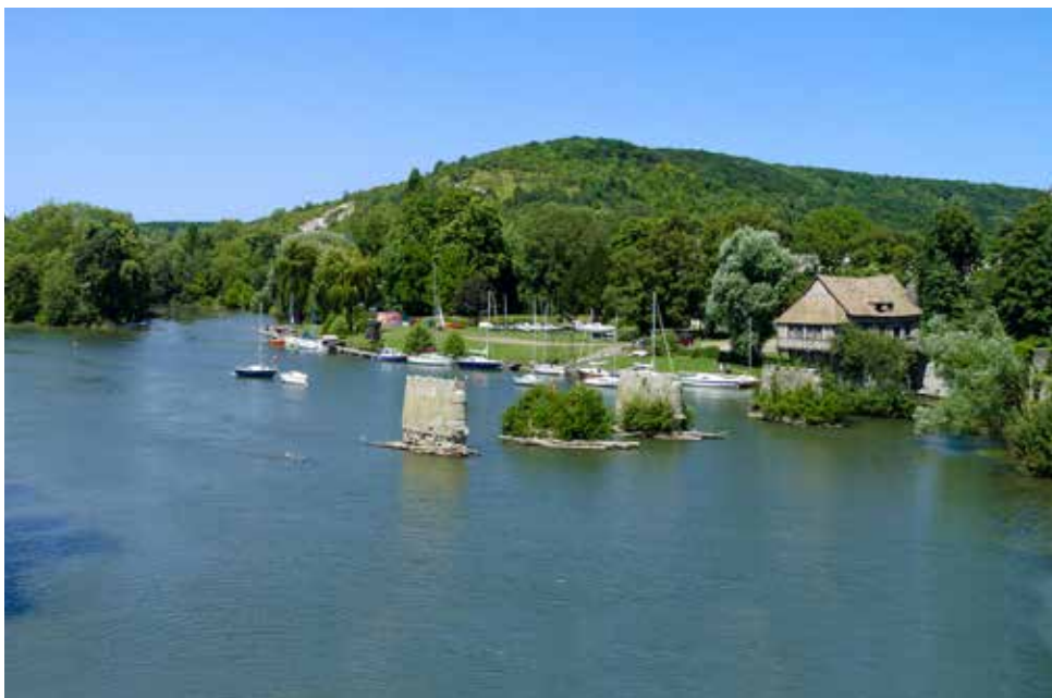
Die alte Mühle bei Vernon