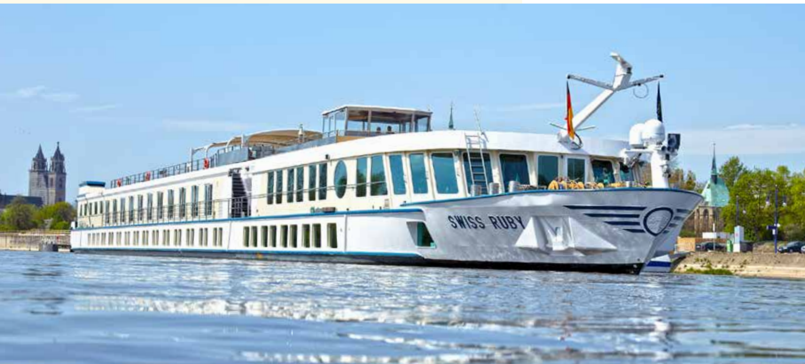
MS Swiss Ruby