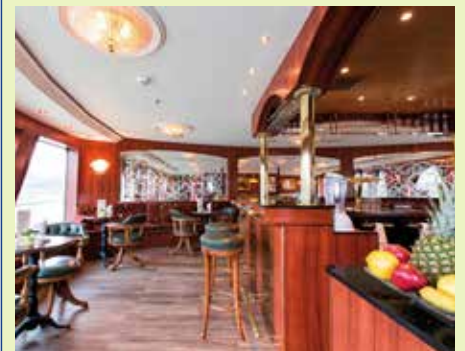
Gepflegte Atmosphäre an Bord