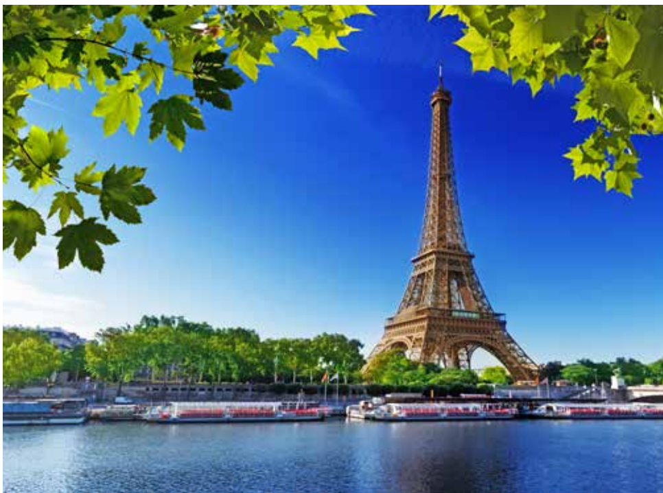
Ihre Flussreise beginnt und endet in Paris

die. Nach dem Frühstück empfehlen wir Ihnen unbedingt die Teilnahme an unserem geführten Stadtrundgang. Die Kathedrale, der große Marktplatz mit Rathaus und vieles mehr erwarten Sie. Am Nachmittag setzen Sie Ihre Fahrt in Richtung Caudebec fort.