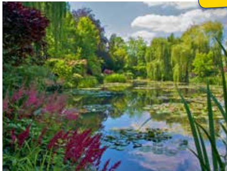
Jardin de Claude Monet, Giverny